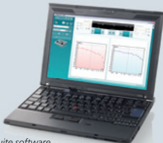
Diagnostic Suite software