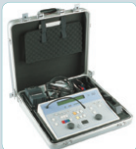
Maletín de transporte rígido

Se pueden presentar el habla y los tonos puros bajo condiciones de campo libre. El sistema disponible abarca desde los 90 dB SPL hasta los 115 dB SPL y ha sido médicamente aprobado. Para la conexión a una cabina insonorizada también se encuentra disponible un conjunto de paneles de conexión AFC8. Para más detalles, consulte con su distribuidor local.